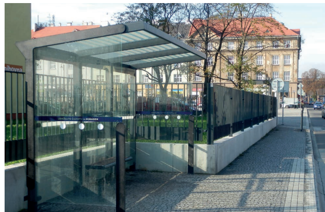
Nová zastávka a oplocení knihovny