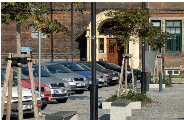
Řada stromů a lavic, které vymezují vnitřní plochu náměstí.

Mobiliář pro náměstí byl použit v větší části atypický – do dlažbou vymezených pruhů byly vsazeny vyvýšené, kamennou obrubou vymezené žardiniéry pro nové stromy, rovněž na kamenné bloky osazené dřevěné lavice, designové odpadkové koše a stožáry veřejného osvětlení. Takové pruhy byly vytvořeny i po obvodu chodníků a po obvodu vnitřní plochy náměstí, takže jasně vymezují plochy komuni-