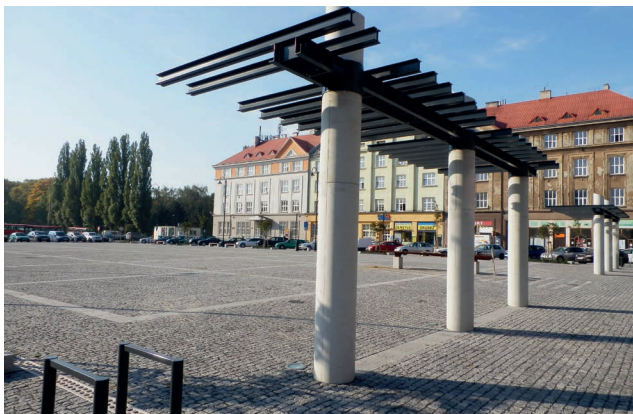
Pohled do pergolou odcloněné části náměstí z horní strany