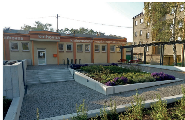
Úprava před knihovnou