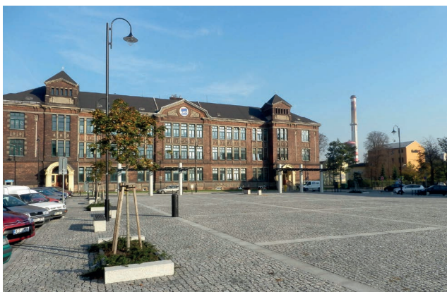
Pohled do horní plochy náměstí směrem ke škole