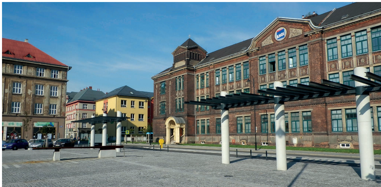
Výsledná podoba horní části náměstí

Náměstí je zklidněno s omezením dopravy, vizuálně je odděleno od rušné Halasovy ulice dvěma pergolami z betonu a oceli, ve svém podélném směru je vybaveno komunikacemi jen pro cílový vjezd – parkování, zásobování. Vnitřní komunikace v náměstí z ulic opatřeny nájezdem, obrubníky zvýšeny. Mobiliář, osvětlení a zeleň vloženy v liniích do pruhů v žulových kostkách a mozaice s odlišným vzhledem a odstínem materiálu – to umožňuje také bezproblémový strojní úklid. Vnitřní plocha náměstí je dělena pomocí pruhů deskové žuly do pravidelného rastru, navazuje tak na obdobné řešení nedalekých ploch před kostelem sv. Pavla. V horní části mezi pergoly osazena fontána – výtok pitné vody se žlabem z Cortenu, původní návrh s novodobou kašnou byl na žádost zástupců městské části Vítkovic redukován z důvodu omezení nákladnější údržby. Do vnitřní plochy je přivedeno NN (nízké napětí), voda a kanalizace pro pořádání různých trhů, jarmarků, vánočního prodeje kaprů, kulturních akcí apod.